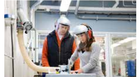
Oppilaitosten purun- ja tekstiilipölynpoistot