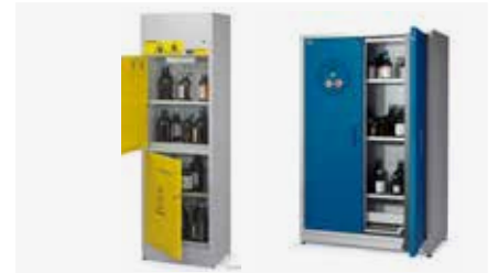
Paloturva- ja kemikaalikaapit