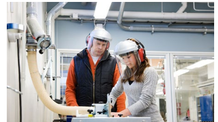
Oppilaitosten purun- ja tekstiilipölynpoistot