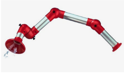
Kohdepoistomovarret kaasuille ja pölyille

Ratkaisemme työympäristön ilmanpuhtauteen liittyvät haasteet. Poistamme ilmasta haitalliset pölyt, käryt, kaasut, höyryt ja muut epäpuhtaudet.