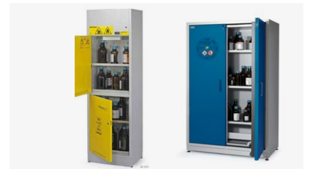
Paloturva- ja kemikaalikaapit