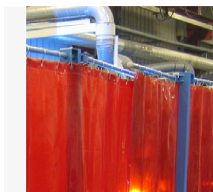
Voidaan laajentaa lisävarustein