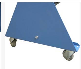
Kääntyvät pyörät pikalukituksella, 4 kpl