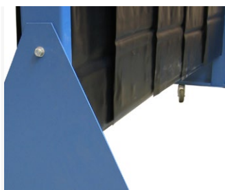
Esteetön kulku - ei alatukea