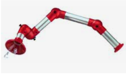
Kohdepoistomuvarret kaasuille ja pölyille

Ratkaisemme työympäristön ilmanpuhtauteen liittyvät haasteet. Poistamme ilmasta haitalliset pölyt, käryt, kaasut, höyryt ja muut epäpuhtaudet.