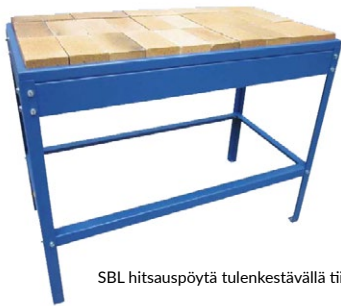
SBL hitsauspöytä tulenkestävällä tiilellä