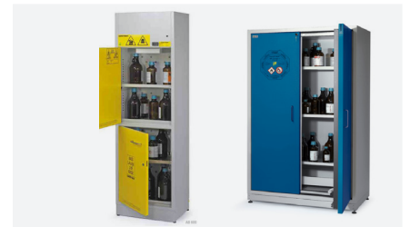
Paloturva- ja kemikaalikaapit