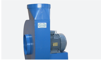
Erikoispuhaltimet, ATEX puhaltimet