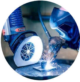
Kohdepoistoimuvaret kaasuille ja pölyille