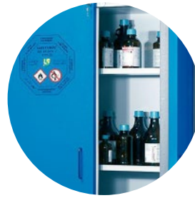
Paloturva- ja kemikaalikaapit