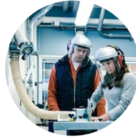
Oppilaitosten purun- ja tekstiilipölynpoistot