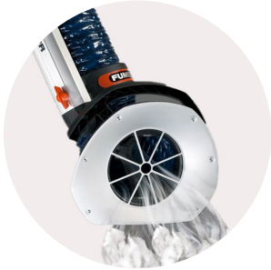
Kohdepoistomuvarret kaasuille ja pölyille