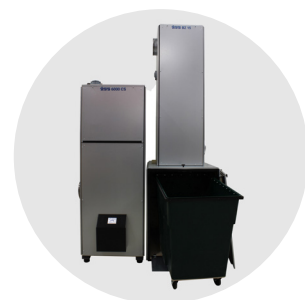
Oppilaitosten purun- ja tekstiilipölynpoistot