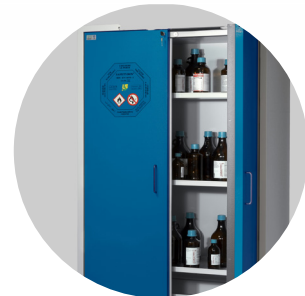
Paloturva- ja kemikaalikaapit