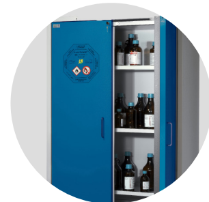
Paloturva- ja kemikaalikaapit