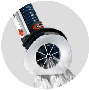
Kohdepoistimuvartet kaasuille ja pölyille