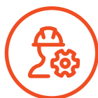
Suunnittelu & mitoitus