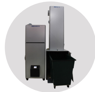
Oppilaitosten purun- ja tekstiilipölynpoistot