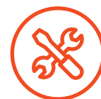
Käyttöönotto & vuosihuollot