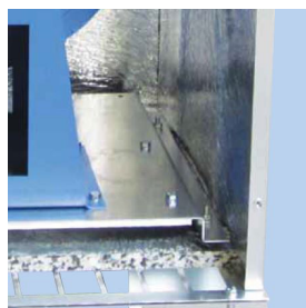
Asennettu tärinänvaimentimien päälle